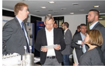
Teilnehmer des Kooperationsforums schauen sich die Exponate der ausstellenden Unternehmen an.