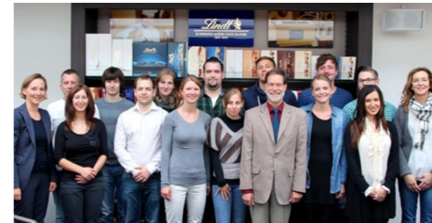
Betriebsbesichtigungen bei Lindt & Sprüngli und Zentis: Mitwirkende aus fünf TROPHELIA-Teams nahmen teil.

Im Nachgang des Wettbewerbs TROPHELIA Deutschland 2013 wurden alle Teams – auch die, die nicht in Bonn ihre Produktideen präsentieren konnten – zu einem „Betriebsbesichtigungs-Tag“ eingeladen. So reisten 16 Studenten der Hochschulen Fulda und Trier, der SRH Fernhochschule Riedlingen und der Universität Hohenheim am 20. September nach Aachen. Am Vormittag stand eine Besichtigung der Fa. Zentis GmbH & Co. KG, am Nachmittag eine Führung durch die Schokoladefabriken Lindt & Sprüngli GmbH auf dem Programm. Beide Unternehmen stellten auch ihre Einstiegsprogramme für Absolventen vor.