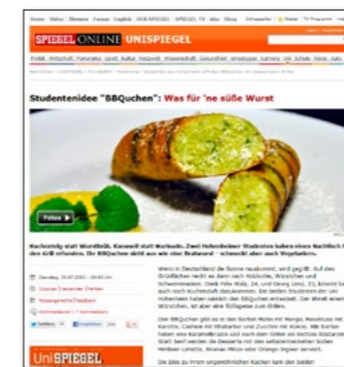
Auch der Spiegel berichtete am 30. Juli 2013 über „BBQuchen“!