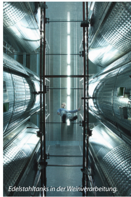
Edelstahltanks in der Weinverarbeitung.

nur selten erreicht wurde, gibt es heute aufgrund des Klimawandels und der damit einhergehenden Reifeverfrühung der Trauben kaum noch Rotweine mit niedrigeren pH-Werten und auch Weißweine liegen oft darüber. Laktobazillen und Pediokokken sind die Hauptproduzenten der biogenen Amine, sie bilden aber auch flüchtige Säure, medizinisch riechende flüchtige Phenole, die für das Mäuseln verantwortlichen Pyridin/Pyrolin-Derivate und die Viskosität erhöhende Polysaccharide. Auffällig war die Tatsache, dass bei mittleren pH-Werten von 3,4 die Bildung dieser unerwünschten Stoffe häufiger zu beobachten war.